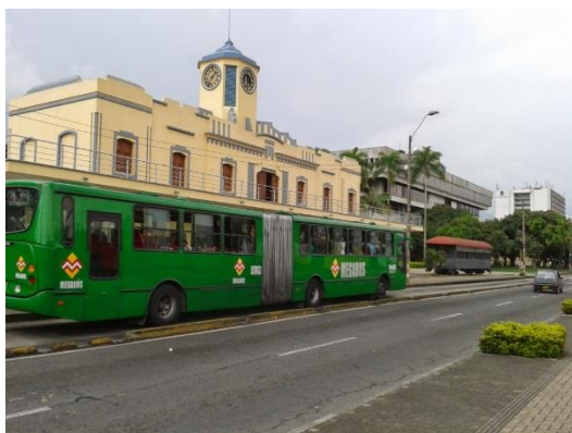
Imagen 2 Megabús. Al fondo la estación del ferrocarril.