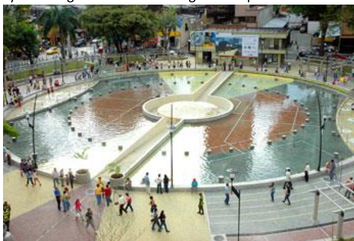
Imagen 5 Parque lago Uribe

Cabe mencionar también la calle de la fundación, nombre dado a la calle 19 comprendida entre las carreras 6 a 13 y que conecta los parques Olaya Herrera y la plaza de Bolívar. Este nombre fue dado a esta calle debido a que se dice que esta calle fue por la que entraron los fundadores de la ciudad.