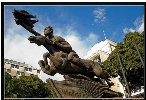
Imagen 4 Bolívar desnudo

Dentro de las plazas y plazoletas destacadas en la ciudad, están la plaza de Bolívar, el parque el lago Uribe Uribe y el parque Olaya Herrera.