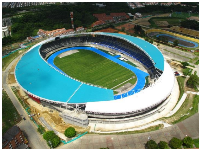
Imagen 3 Estadio Hernán Ramírez Villegas

En La Villa Olímpica, ubicada al occidente de la ciudad y cerca del aeropuerto, se puede encontrar el estadio Hernán Ramírez Villegas, llamado así en homenaje al arquitecto encargado de su construcción. También se encuentra las piscinas olímpicas, velódromo, canchas de tenis y otros espacios deportivos, ideales para los que les guste el deporte.