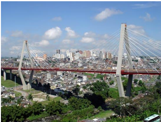
Imagen 1 Viaducto Cesar Gaviria

En ese tiempo, la ubicación geográfica fue un factor muy importante para el desarrollo de la ciudad, debido a que era parte de rutas comerciales entre Santa fe de Bogotá, Cali, Antioquia y Chocó. Hechos como este impulsaron a que la entonces aldea que hacía parte del estado de Cauca pasara a ser la capital de su propia región, lo cual se dio en 1967.