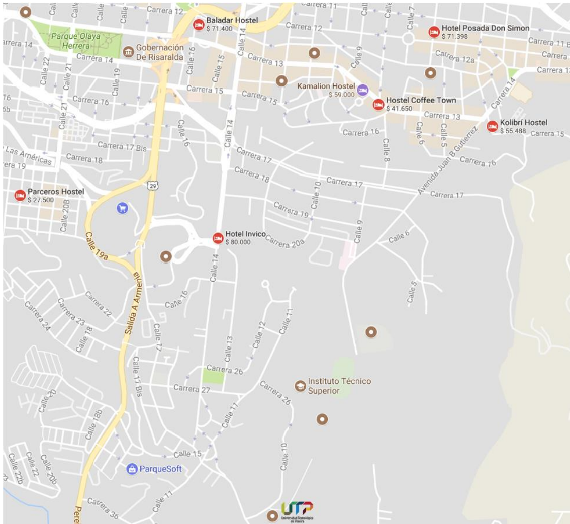
Ubicación geográfica de los hospedajes.